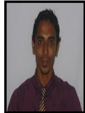
نائبین و ڈیپٹی نائبین و ڈیپٹی