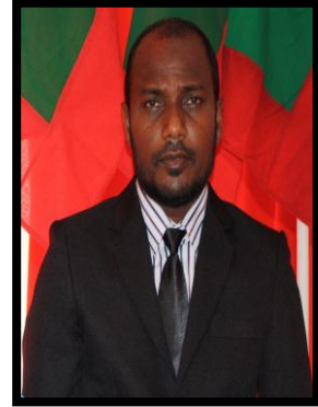
نائبین و ڈیپٹی نائبین و ڈیپٹی