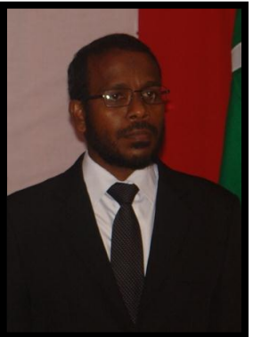
نائبین و ڈیپٹی نائبین و ڈیپٹی