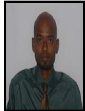
نائبین و ڈیپٹی نائبین و ڈیپٹی