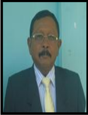
نائبین و ڈیپٹی نائبین و ڈیپٹی