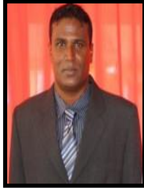
نائبین و ڈیپٹی نائبین و ڈیپٹی